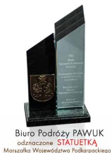
Biuro Podróży PAWUK odznaczone STATUETKĄ Marszałka Województwa Podkarpackiego

Biuro Podróży PAWUK – zostało założone przez przewodników górskich, którzy zakochali się w Karpatach, w szczególności w Bieszczadach. Za pracę nad rozwojem bieszczadzkiej turystyki zostaliśmy odznaczeni jako jedyne bieszczadzkie biuro podróży statuetką za szczególną aktywność w rozwoju turystyki i jej promocji przez Marszałka Województwa Podkarpackiego.