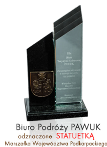
Biuro Podróży PAWUK odznaczone STATUETKA Marszałka Województwa Podkarpackiego

Biuro Podróży PAWUK – zostało założone przez przewodników górskich, którzy zakochali się w Karpatach, w szczególności w Bieszczadach. Za pracę nad rozwojem bieszczadzkiej turystyki zostaliśmy odznaczeni jako jedyne bieszczadzkie biuro podróży statuetką za szczególną aktywność w rozwoju turystyki i jej promocji przez Marszałka Województwa Podkarpackiego .